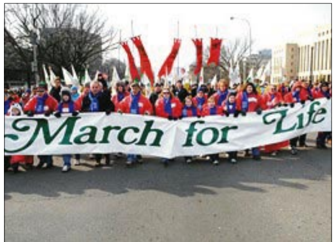
Un aspecto de la Marcha contra el aborto en Washington

Sin embargo, la prensa en general y la chilena en particular no vio nada, no supo nada. En realidad, no es algo nuevo. Es sabido que el macro-capitalismo publicitario hace propaganda del aborto y de otras abominaciones, contrarias a la Moral.