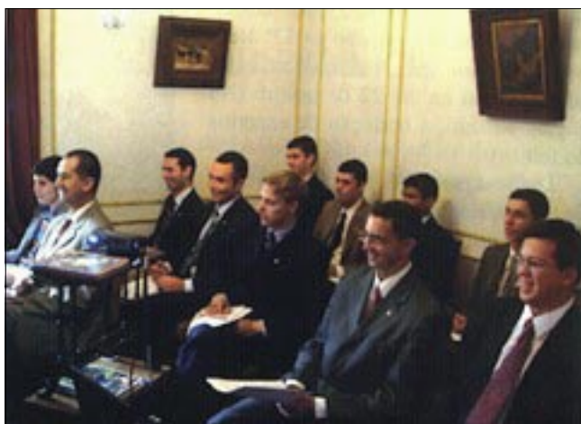
Simposio de formación para universitarios

ENERO: Acción Familia envía una delegación al simposio de formación para universitarios organizado por la "Asociação dos Fundadores" en São Paulo (Brasil) entre los días 25 y 29.